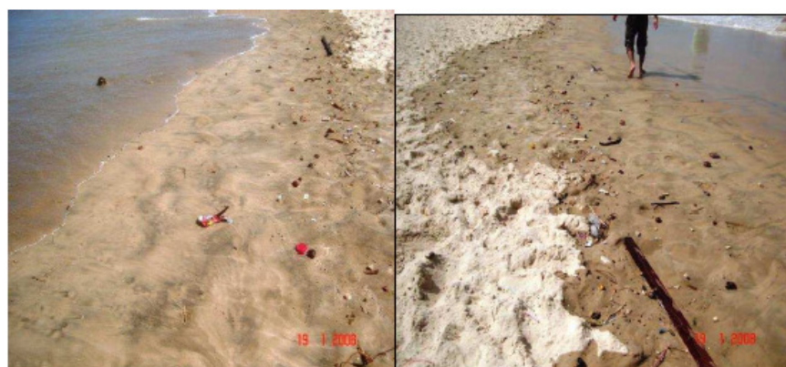
Figura 2 - Praia da Leste-Oeste Resíduos Sólidos na areia.