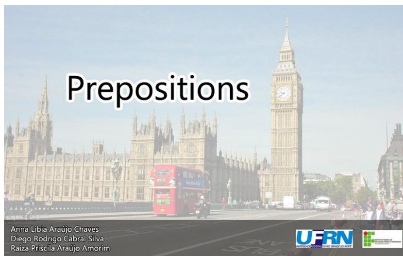
Figura 1 – Tela inicial do OA sobre Preposições.

A Figura 1 mostra a tela de apresentação do OA que trata sobre preposições.